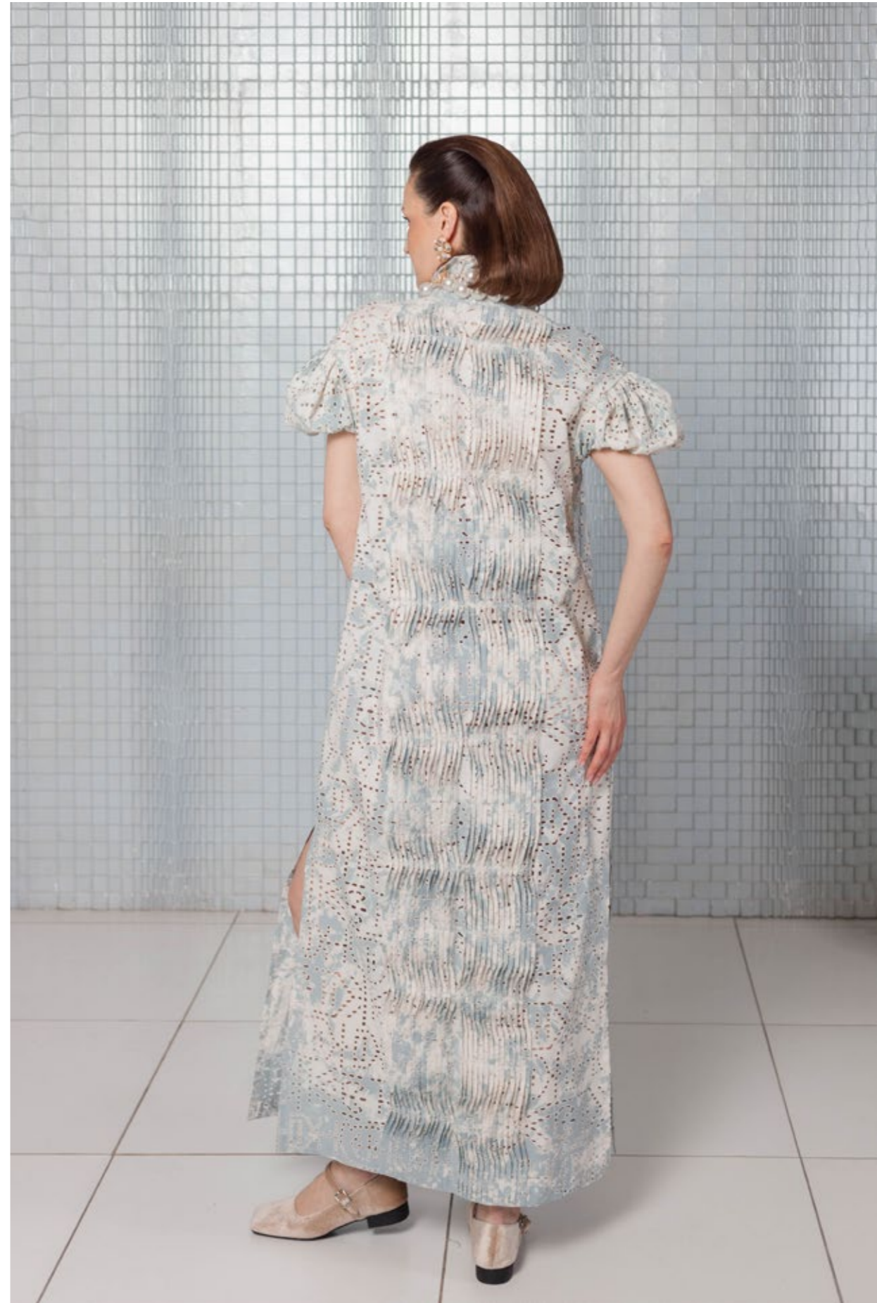
На Елене: Платъе (арт.10) Состав: 100% хлопок Размер XS/S, M/L, XL - 35 000 р.