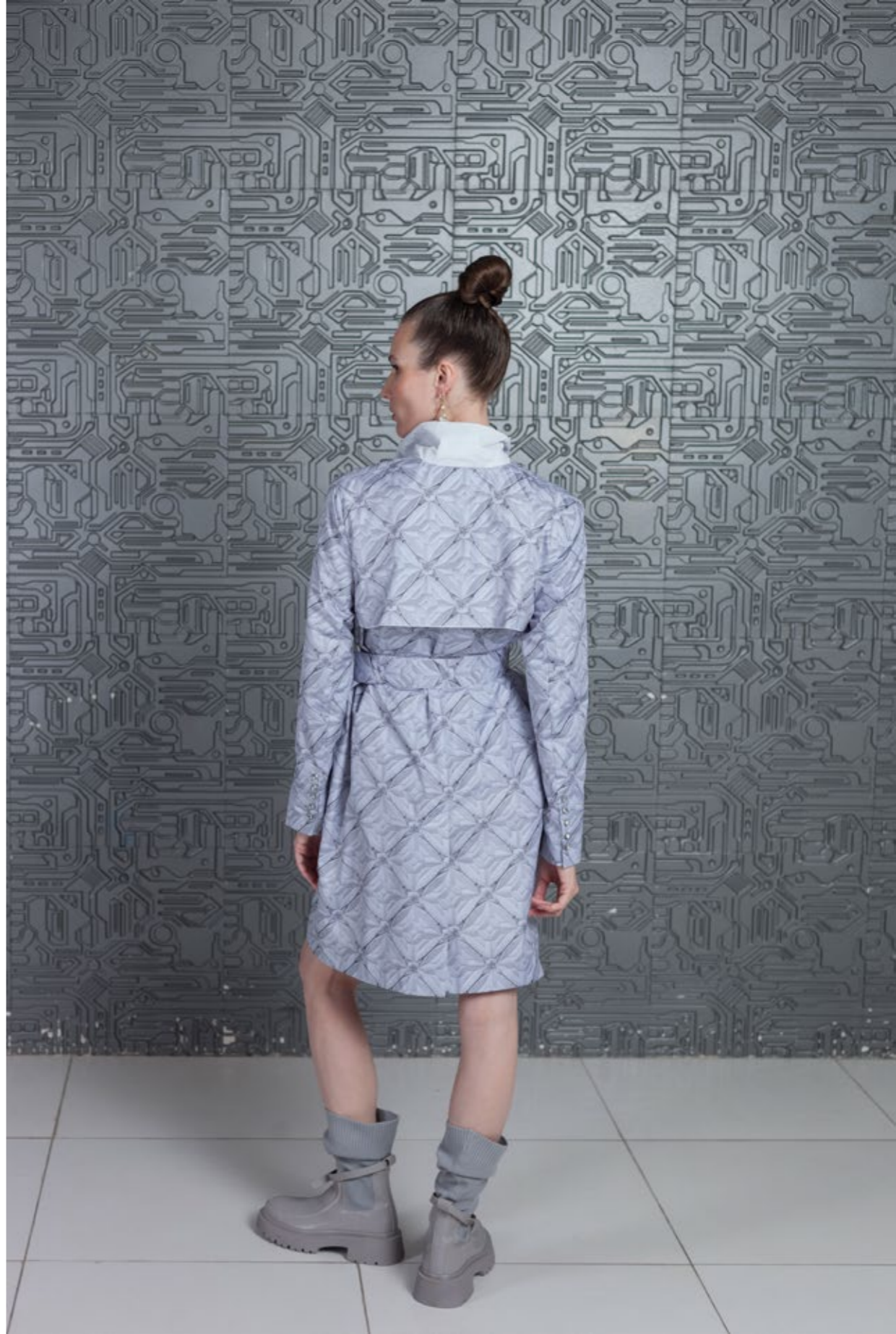
На Юле: Плащ с авторским принтом (арт. 30) Состав: п/э 100%, ручная вышивка кристаллами, подклад - вискоза 100% Размер XS/S, M/L, XL - 43 000 р.