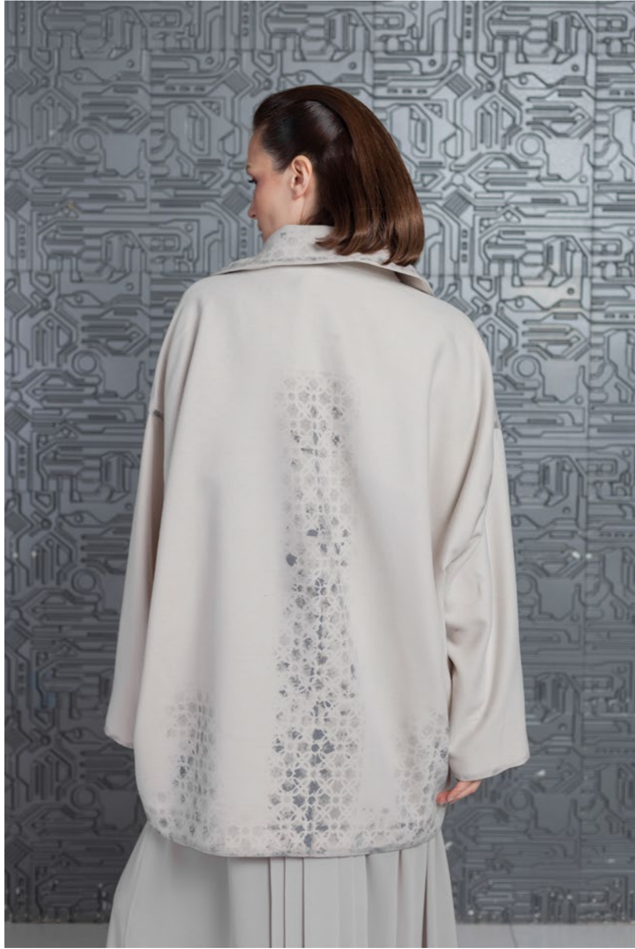
На Елене: Пальто с принтом (арт.35) Состав: Шерсть 60%, вискоза 40%, подклад - 100% вискоза Размер: XS/S, M/L, XL - 42 000 р. Платье (арт.36) Состав: 100% п/э Размер XS/S, M/L, XL - 23 000 р.