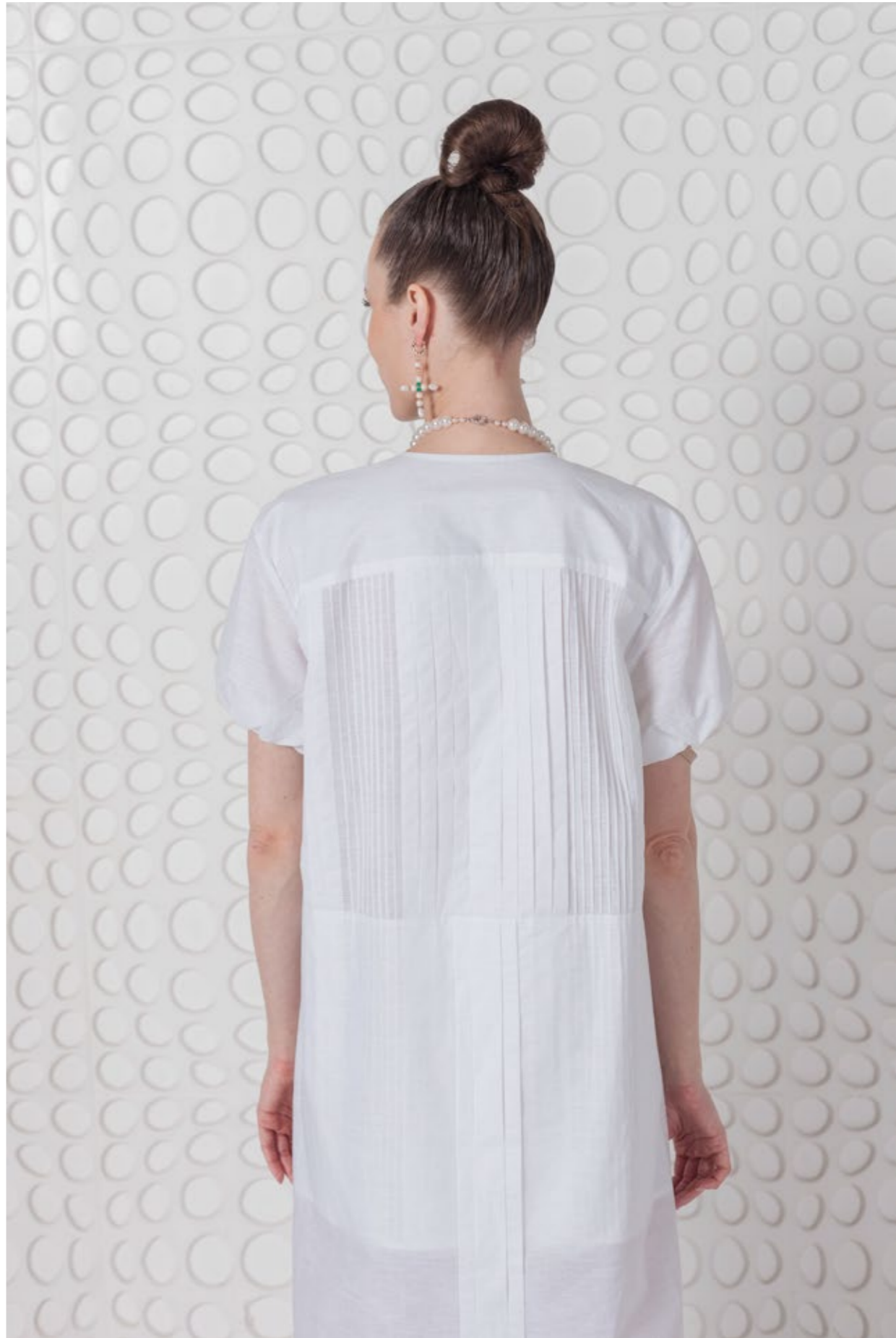
На Юле: Платъе (арт.13) Состав: 100% лен Размер XS/S, M/L, XL 29 000 р.