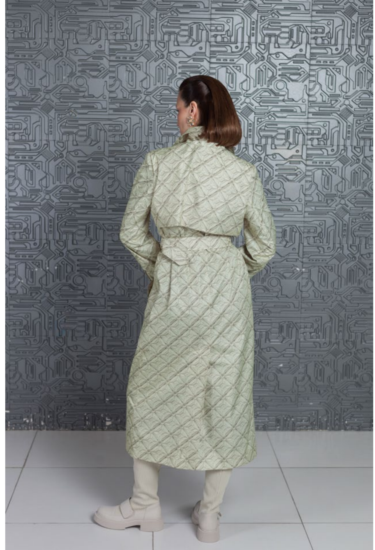
На Елене: Плащ с авторским принтом (арт. 31) Состав: п/э 100%, подклад - вискоза 100% Размер XS/S, M/L, XL - 47 000 р.