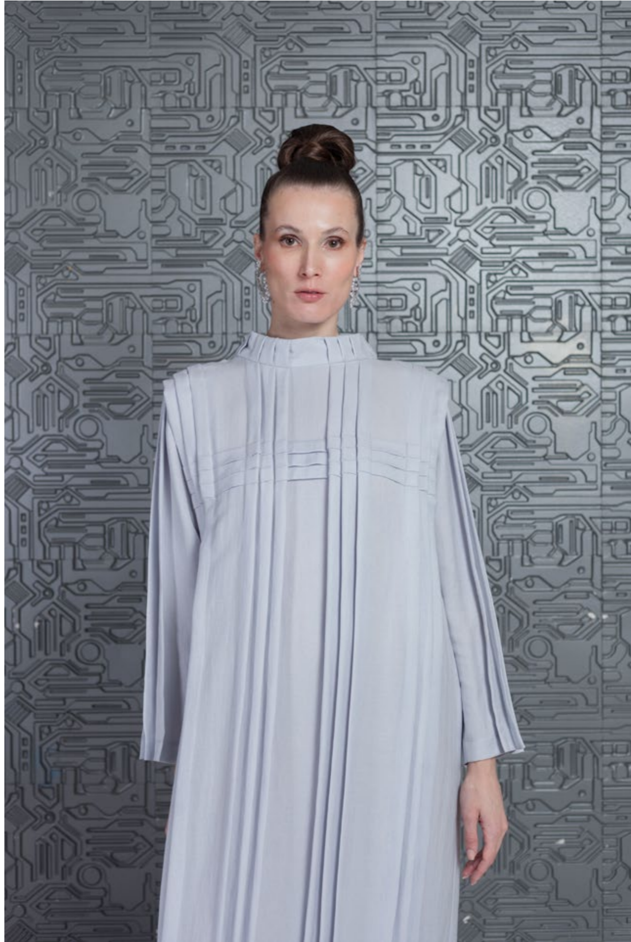
На Юле: Платье (арт.37) Состав: 100% вискоза Размер XS/S, M/L, XL - 42 000 р.