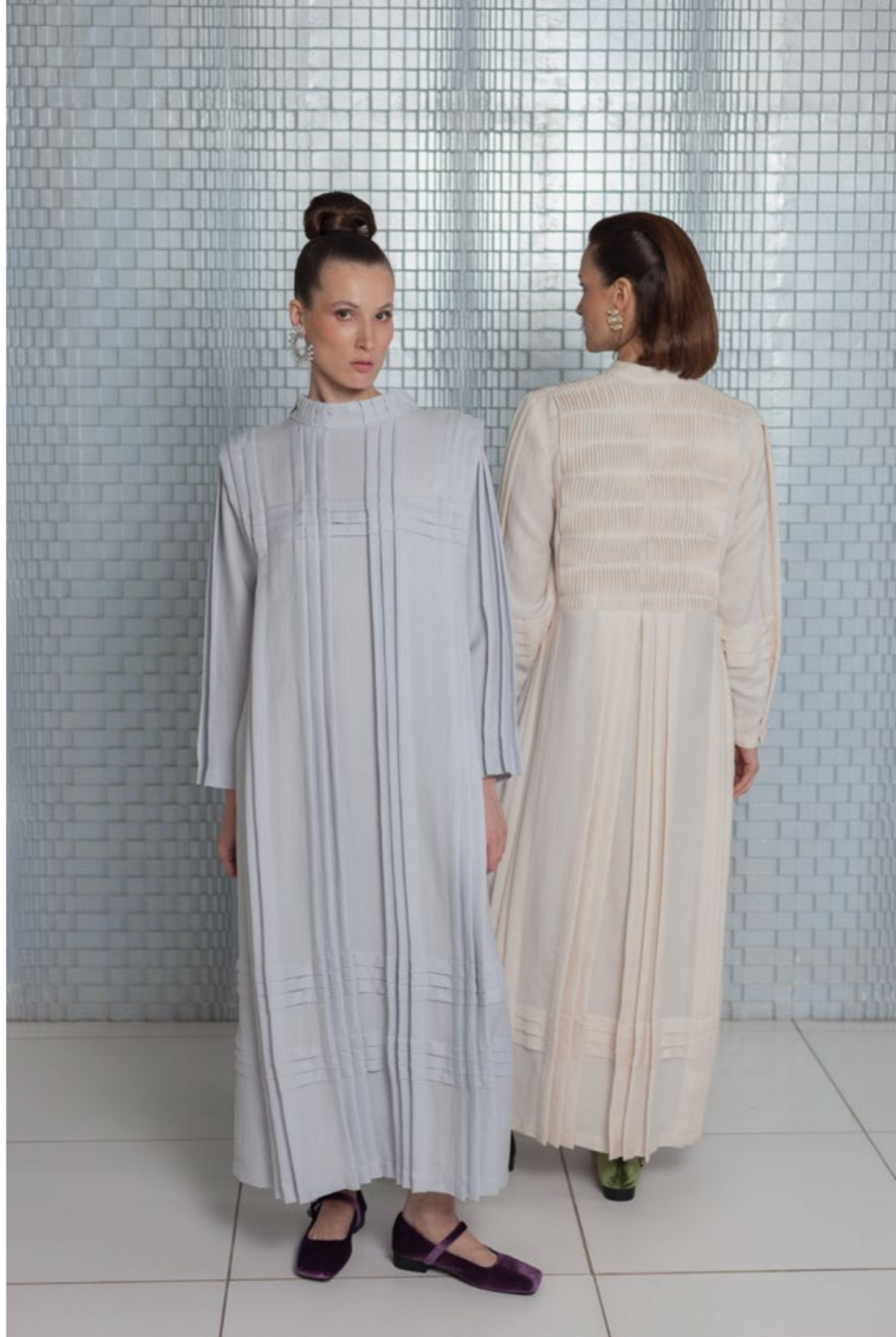
На Елене: Платье (арт.38) Состав: 100% вискоза Размер XS/S, M/L, XL - 45 000 р.